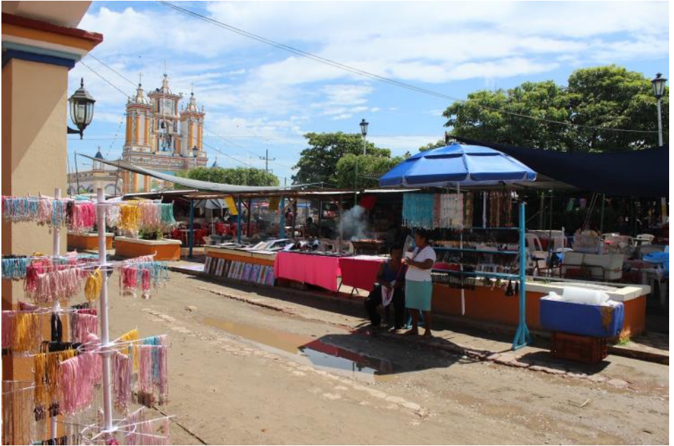
Iglesia y Cupilco en fiesta-