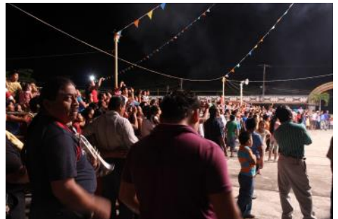
Gente en la plaza.

En la noche, Cupilco se llena de flores, colores, música, comida para continuar la fiesta... Después de la misa de las 19.00, bombas, fuegos artificiales, toritos, globos y gente, mucha, ¡muchísima gente está lista para la fiesta!