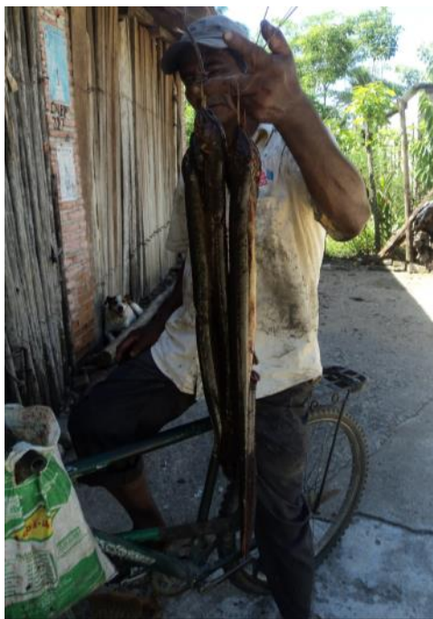
Campesino vendiendo "culebras de agua" o anguilas.