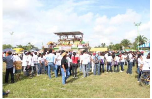
Legada de los primeros jóvenes.